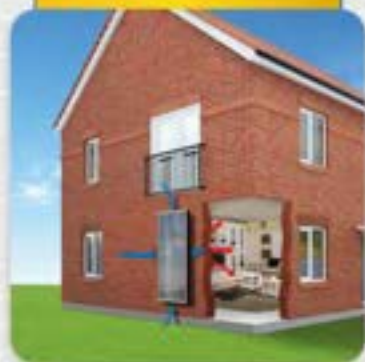
Luftsolfangere til villaer