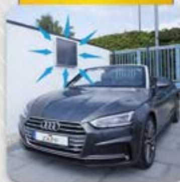
Luftsolfangere til garager