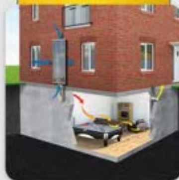
Luftsolfangere til kældre