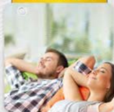
Luftsolfangere til automatiseret komfortventilering i villaer