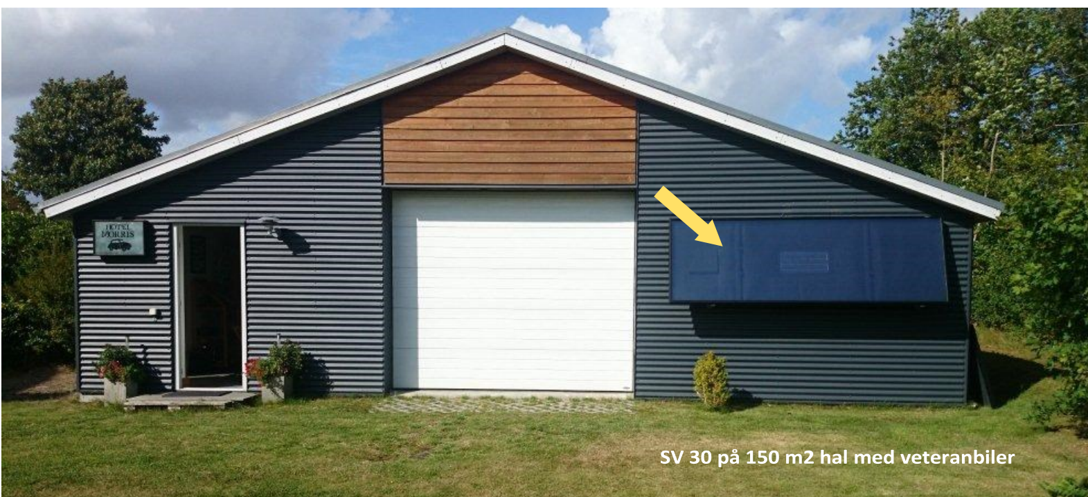
SV 30 på 150 m2 hal med veteranbiler

De forskellige modelstørrelser kan man se på vores hjemmeside www.solarventi.dk